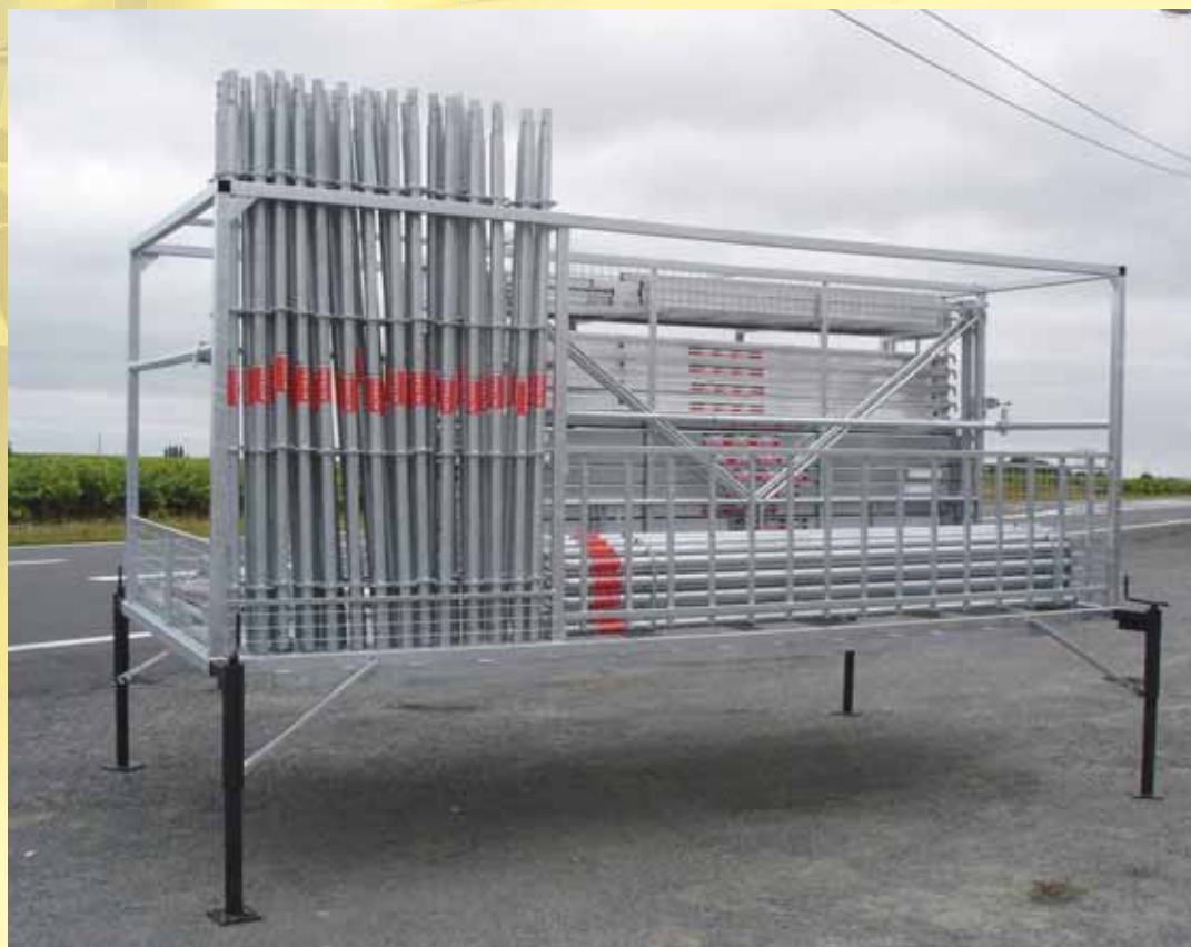
Exemple de configuration avec composants - poids - surface.