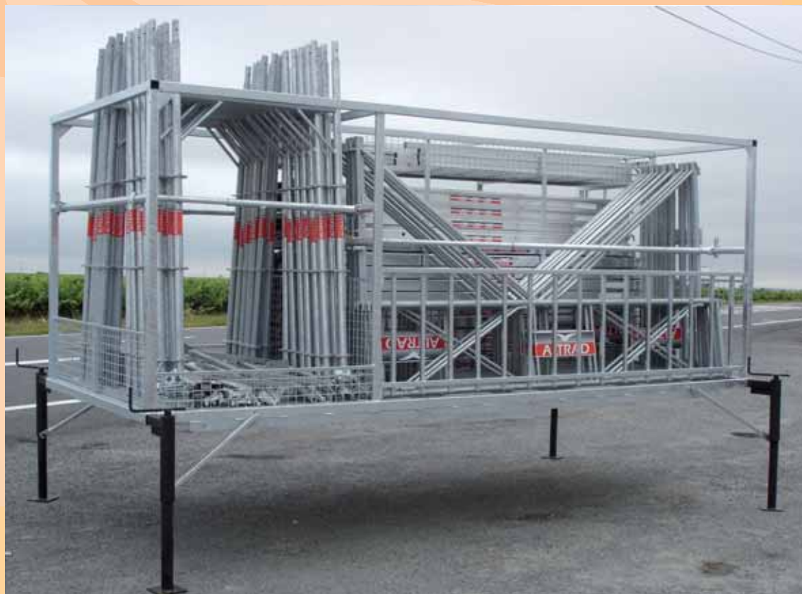
Exemple de configuration avec composants - poids - surface.