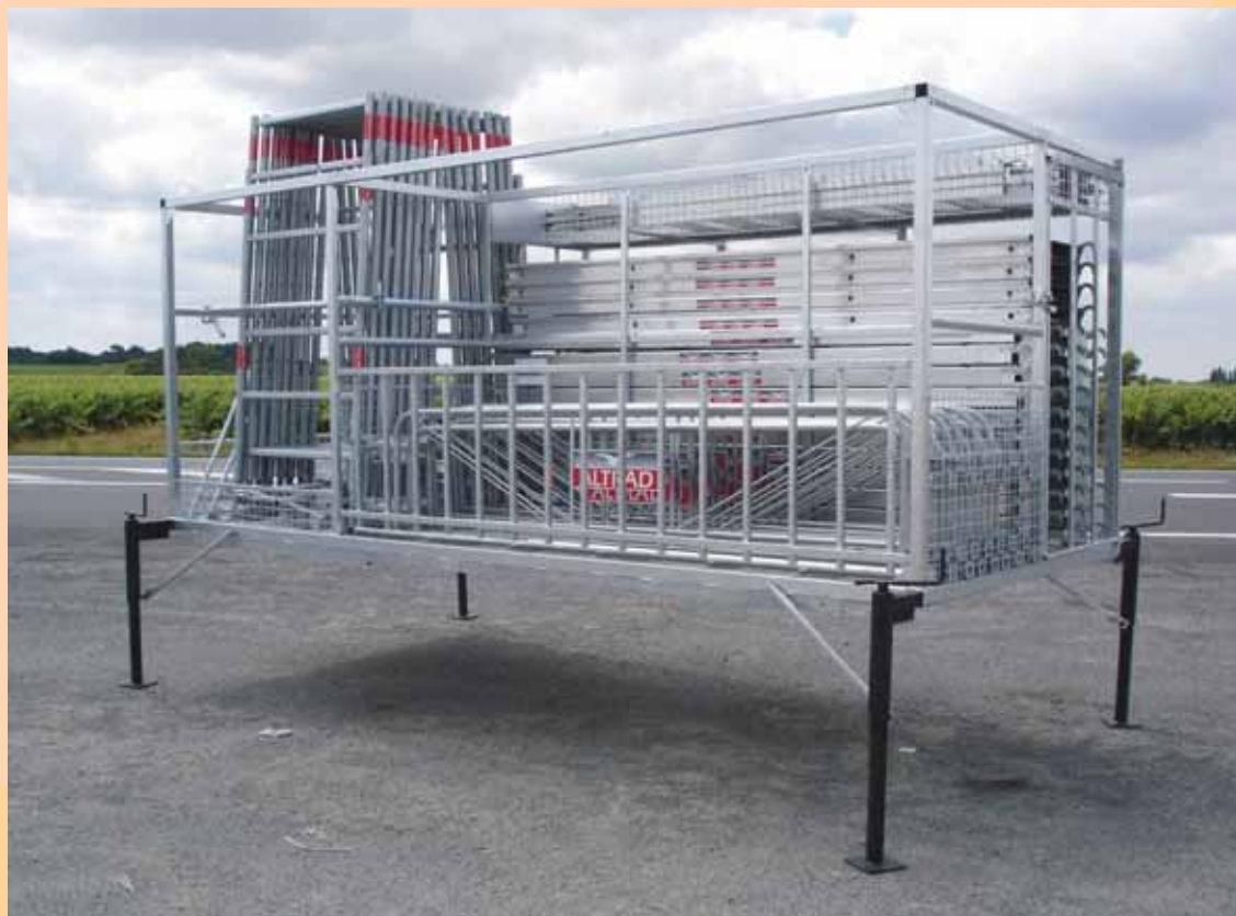
Exemple de configuration avec composants - poids - surface.